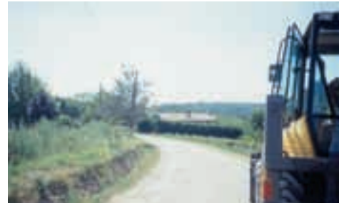
Viabilité du virage du courtil Marcillac saint-Quentin