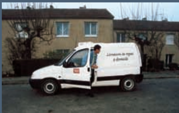
Le service de portage de repas à domicile a été étendu à l'ensemble des communes de la Communauté.