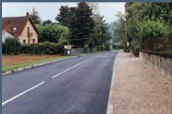
Un exemple des travaux de voirie entrepris par la Communauté de Communes du Sarladais.