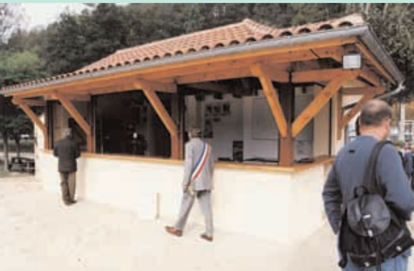
Réhabilitation du club house de l'étang de Tamniès.