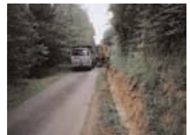
drainage du chemin rural des rhodes au cambourtet