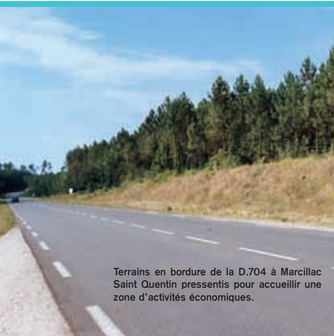
Terrains en bordure de la D.704 à Marcillac Saint Quentin pressentis pour accueillir une zone d'activités économiques.

La mise en commun de moyens et de compétences pourrait se concrétiser au-delà de la Communauté de Communes du Sarladais. D'autres partenariats méritent d'être soutenus comme par exemple ceux avec la Communauté de Communes du Salignacois ou du Périgord Noir. Une réunion de travail entre élus a d'ores et déjà permis de dessiner les contours d'actions partagées avec la Communauté de Communes du Salignacois.