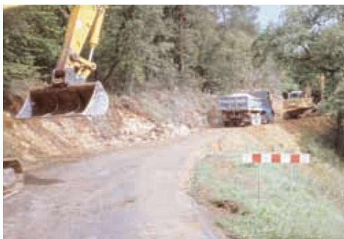
Travaux Vallon des Combes à Proissans