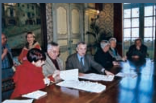
Signature officielle par les maires de la Communauté de Communes du "Contrat Temps Libres" et du "Contrat Enfance" avec la C.A.F.