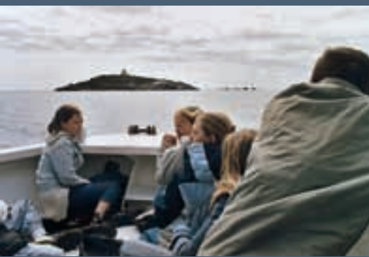
L'ensemble des jeunes de la Communauté de Communes du Sarladais peut désormais accéder à de nombreuses activités qui leur sont destinées, à des tarifs préférentiels et identiques pour tous.